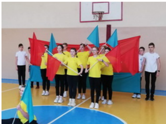
Итоги субботы □ (29 февраля 2020 г.) □